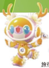
旅行節マスコットキャラクター「楽楽」